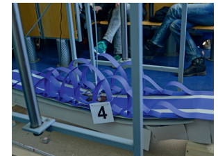
Beispiel für die Brücken-Box

Mit der Teilnahme am Schülerwettbewerb erklären sich die Teilnehmenden damit einverstanden, dass Mitarbeiter und/oder beauftragte Dienstleister Foto- und/oder Filmaufnahmen zum Wettbewerb anfertigen. Die Aufnahmen dienen nicht-kommerziellen Werbezwecken, sie sollen in eigenen Print- und Onlinemedien veröffentlicht werden und externen Medien (Print, Rundfunk, Online) zur Veröffentlichung zur Verfügung gestellt werden. Die Teilnehmenden erklären mit Ihrer Anmeldung am Wettbewerb, dass die Zustimmung zur Veröffentlichung wie vorgenannt vorliegt.